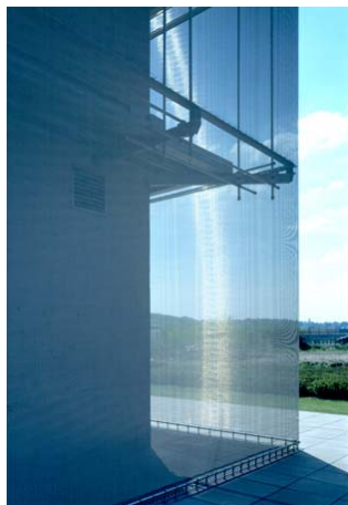
Figura 1: Transparencia y juego de luces en el Expomedia Light Cube, Saarbrücken.