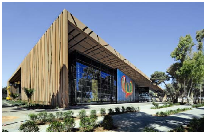
Figura 1: Fachada de acero bronceado del tipo Kiwi en combinación con una fachada Mediamesh® en el Tripoli International Convention Center.