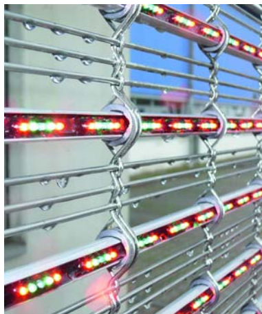
Figura 1: Malla Mediamesh® .