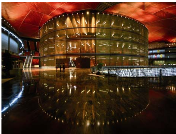
Figura 1 © GKD/ Kumpulan Senireka Sdn Bhd