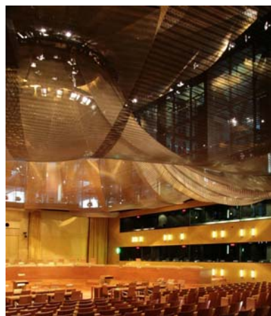
del Tribunal Europeo de Justicia en Luxemburgo.