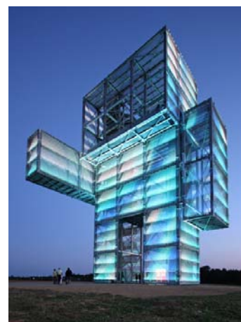
monumento industrial y un punto turístico culminante.