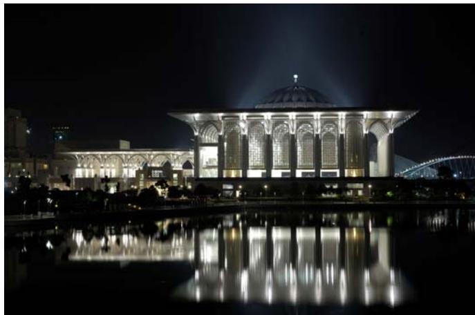
Figura 1: El destacado monumento característico de la nueva sede del gobierno malayo en Putrajaya es la Mezquita Tuanku Mizan Zainal Abidin.